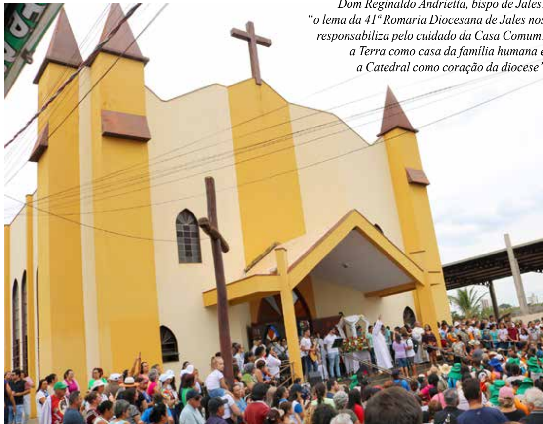
A concentração da Romaria acontecerá a partir das 14h, em frente à Igreja Santo Expedito, em Jales