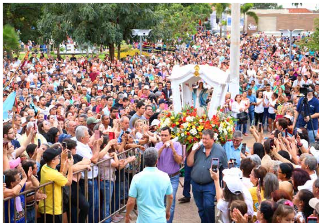
A Romaria Diocesana de Jales 2025 tem como lema "Unidos em Cristo, com Maria, cuidamos de nossa Casa Comum", celebrando o Jubileu de Ouro – 50 anos da Catedral de Jales