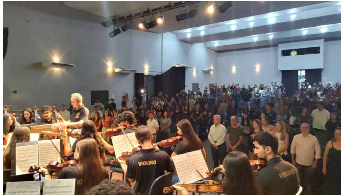
Apresentação da Orquestra Sinfônica de Jales