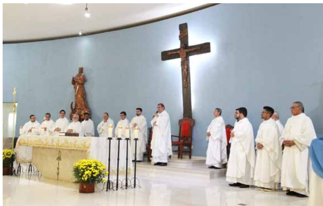
Durante a missa presidida pelo Bispo Diocesano foi criado o Tribunal Diocesano