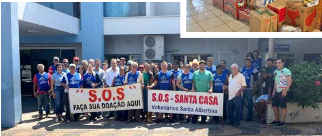
Em torno de 60 voluntários participaram do arrastão "SOS Santa Casa" arrecadando mais de 8,5 toneladas de alimentos.

depositar o alimento em caixas coletoras que estão dispostas em estabelecimentos da cidade de Jales e região. A campanha Alimento Solidário de setembro solicita a doação dos itens: bis-