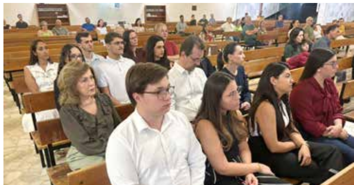
Alunos e docentes do curso direito na missa celebrada na Catedral de Jales