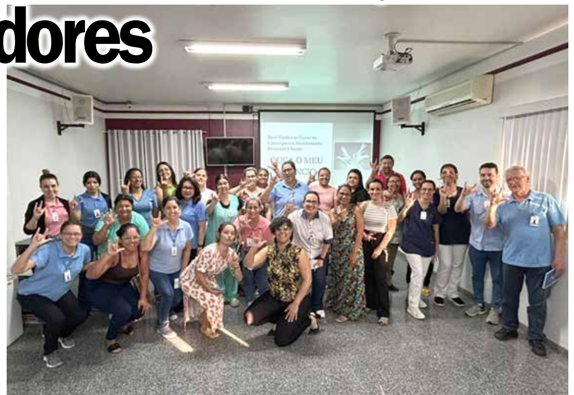
Os colaboradores participantes do curso em Libras, fazendo o sinal "Te Amo".

Setembro Azul: conhecido como "Setembro Azul" ou "Setembro Surdo", este mês celebra as conquistas e a identidade da