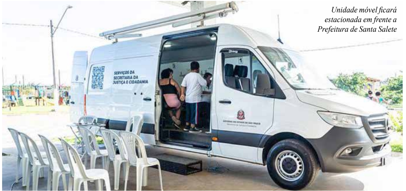
Unidade móvel ficará estacionada em frente a Prefeitura de Santa Salete

O projeto ainda conta com orientações sobre o PROCON, Defensoria Pública e a plataforma Trampolim, bem como atendimentos voltados às políticas públicas de diversidade, direitos humanos e proteção social. Haverá recebimento de denúncias, orientações e encaminhamentos relacionados à Coordenação de Políticas de Diversidade Sexual, Po-