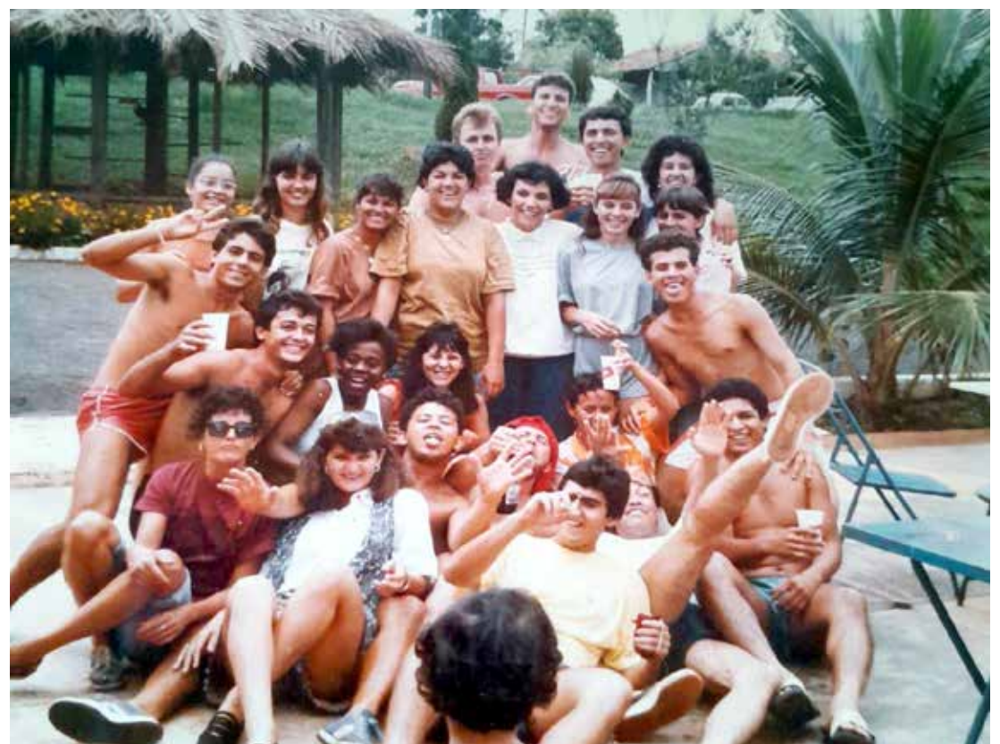
Formandos do curso de Educação Física da FUNEC de Santa Fé do Sul em 1989