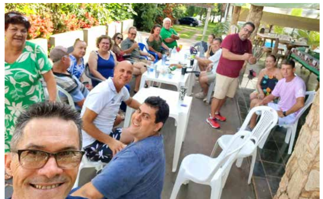
O relógio seguiu seu curso, a vida nos levou por caminhos diferentes, mas algo permaneceu intacto: a essência daquela turma que acreditava no futuro e que fez da amizade uma lição eterna