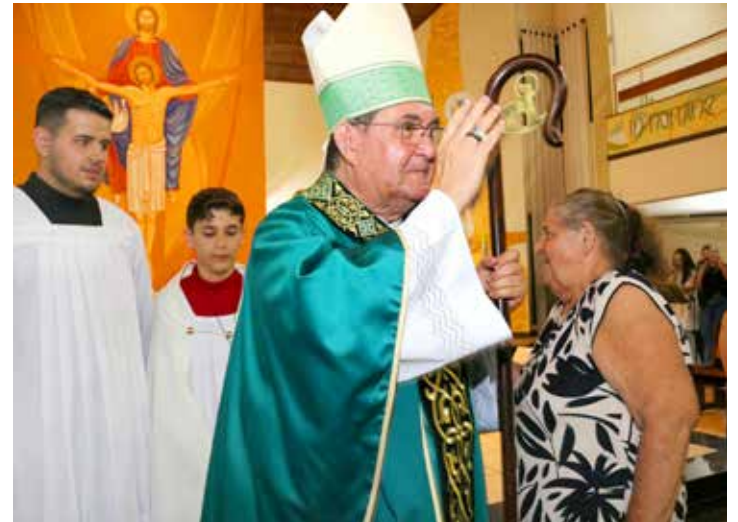
A missa foi em ação de graças pelos 10 anos de ministério episcopal de Dom Reginaldo Andrietta na Diocese de Jales

Dom Demétrio comemorou no sábado, 31 de janeiro, 86 anos de vida. Desses, ele dedicou mais de 30 anos como bispo de Jales