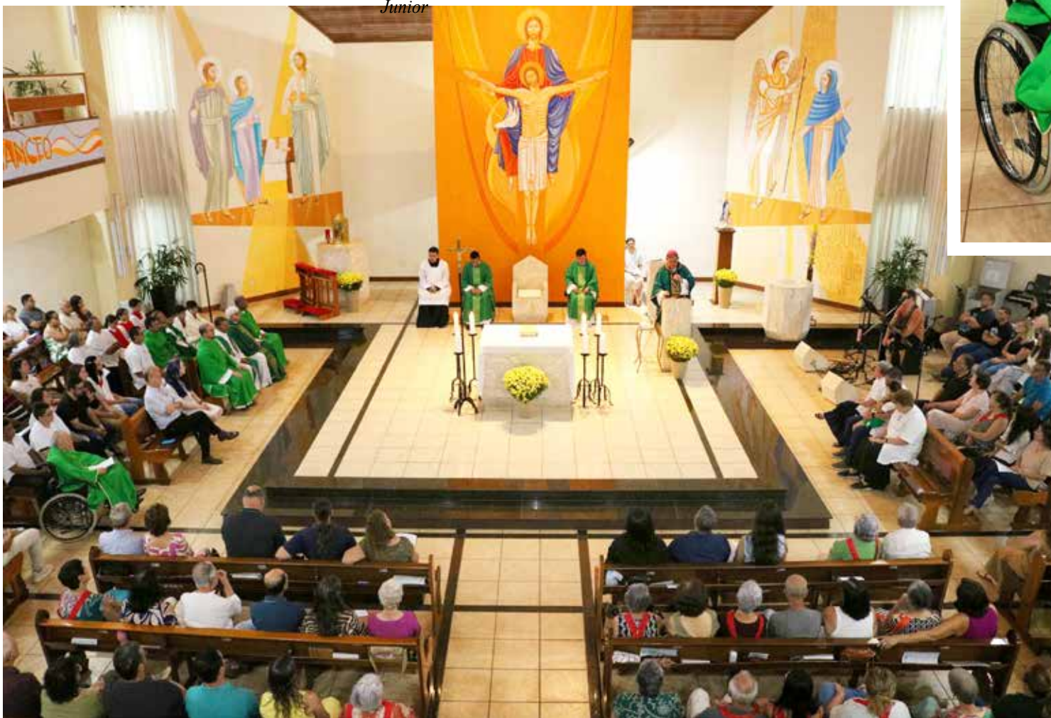
Toda a comunidade católica de Jales e de toda a diocese participou da celebração eucarística no Santuário da Santíssima Trindade